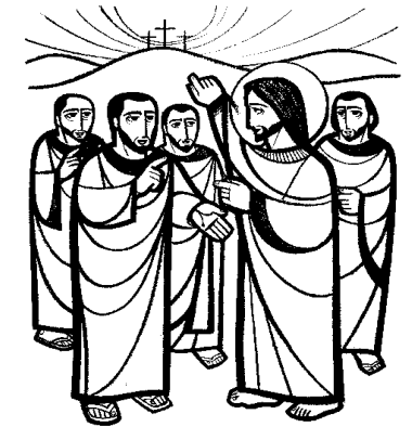
El Hijo del hombre tiene que padecer mucho DOMINGO XXIV DEL TIEMPO ORDINARIO

En aquel tiempo, Jesús y sus discípulos se dirigieron a los pueblos de Cesarea de Filipo; por el camino, preguntó a sus discípulos: ¿Quién dice la gente que soy yo? Ellos le contestaron: -“Unos, Juan Bautista; otros, Elías; y otros, uno de los profetas”. “Él les preguntó: -“Y ustedes, ¿quién dicen que soy? Pedro le contestó: Tú eres el Mesías. Él les prohibió terminantemente decírselo a nadie. Y empezó a instruirlos. -“El Hijo del hombre tiene que padecer mucho, tiene que ser condenado por los ancianos, sumos sacerdotes y escribas, ser ejecutado y resucitar a los tres días”. Se lo explicaba con toda claridad. Entonces, Pedro lo llevó aparte y se puso a increparlo, Jesús se volvió y, de cara a los discípulos, increpó a Pedro: -“¡Quítate de mí vista, Satanás! ¡Tú piensas como los hombres, no como Dios!” Después llamo a la gente y a sus discípulos, y les dijo: -“El que quiera seguirme, que renuncie a sí mismo, que cargue con su cruz y me siga. Porque, el que quiera salvar su vida la perderá; pero el que pierda su vida por mí y por el Evangelio, la salvará”.