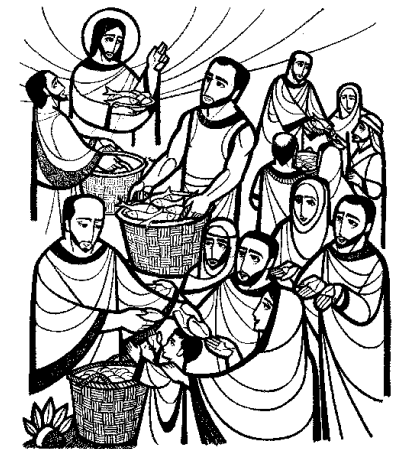
Comieron todos y se saciaron SOLEMNIDAD DEL SANTÍSIMO CUERPO Y SANGRE DE CRISTO

El primer día de los Ázimos, cuando se sacrificaba el cordero pascual, le dijeron a Jesús sus discípulos: - "¿Dónde quieres que vayamos a prepararte la cena de Pascua". Él envió a dos discípulos, diciéndoles: - "Vayan a la ciudad, encontraron un hombre que lleva un cántaro de agua; síganlo y, en la casa en que entre, díganle al dueño: "El Maestro pregunta: ¿Dónde está la habitación en que voy a comer la Pascua con mis discípulos?". Él les mostrará en el piso de arriba una sala grande y bien alfombrada. Prepárennos allí la cena". Los discípulos salieron, llegaron a la ciudad, encontraron lo que les había dicho y prepararon la cena de Pascua. Mientras comían, Jesús tomó un pan, pronunció la bendición, y lo partió y se lo dio, diciendo: - "Tomen, esto es mi cuerpo". Y, tomando en sus manos una copa, pronunció la acción de gracias, se la dio, y todos bebieron. Y les dijo: - "Esta es mi sangre, sangre de la alianza derramada por todos. Les aseguro que no volveré a beber del fruto de la vid hasta el día que beba el vino nuevo en el reino de Dios". Después de cantar los salmos, salieron para el monte de los Olivos.