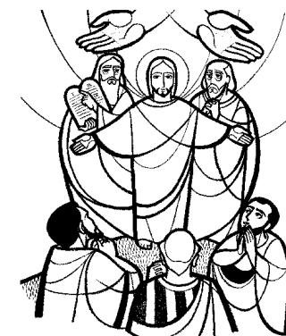
Este es mi Hijo amado, escúchadlo DOMINGO II DE CUARESMA

En aquel tiempo, Jesús se llevó a Pedro, a Santiago y a Juan, subió únicamente con ellos a una montaña alta, y se transfiguró delante de ellos. Sus vestidos se volvieron de una blancura deslumbrante, como nadie en el mundo podría blanquearlos. Se les aparecieron Elías y Moisés, conversando con Jesús. Entonces Pedro tomó la palabra y le dijo a Jesús: - "Maestro, ¡qué bien se está aquí! Vamos a hacer tres tiendas, una para ti, otra para Moisés y otra para Elías". No sabía lo que decía, porque estaban asustados. Se formó una nube que los cubrió, y salió una voz de la nube: - "Éste es mi Hijo amado, escúchenlo". De pronto, al mirar alrededor, no vieron a nadie más que a Jesús solo con ellos. Cuando bajaban de la montaña, Jesús les mandó: - "No cuenten a nadie lo que ustedes han visto, hasta que el Hijo del hombre resucite de entre los muertos". Esto se les quedó grabado, y discutían qué querría decir aquello de "resucitar de entre los muertos".