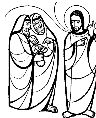
Dad al César lo que es del César, y a Dios lo que es de Dios 29º DOMINGO DEL TIEMPO ORDINARIO

En aquel tiempo, se retiraron los fariseos y llegaron a un acuerdo para comprometer a Jesús con una pregunta. Le enviaron unos discípulos, con unos partidarios de Herodes, y le dijeron: -"Maestro, sabemos que eres sincero y que enseñas el camino de Dios conforme a la verdad; sin que te importe nadie, porque no miras la condición de las personas. Dinos, pues, qué opinas: ¿es lícito a pagar impuesto al César o no?". Pero Jesús, conociendo su malicia, les dijo: -"Hipócritas, ¿por qué me tientan? Enseñenme la moneda del impuesto". Le presentaron un denario. Él les preguntó: -"¿De quién es esa cara y esta inscripción?". Le respondieron: -"Del César". Entonces les dijo: -"Pues denle al César lo que es del César y a Dios lo que es de Dios".