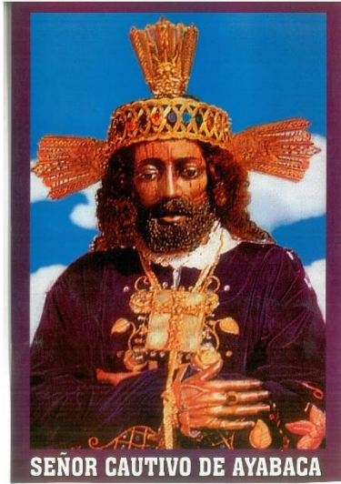
SEÑOR CAUTIVO DE AYABACA

QUINARIO AL SEÑOR DE LOS MILAGROS, del 13 al 17 de octubre a las 5:00p.m. (Sábado y Domingo a las 4:00p.m.)