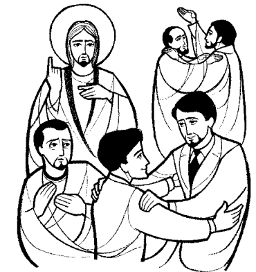
Amad a vuestros enemigos 7º DOMINGO DEL TIEMPO ORDINARIO