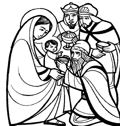
Vieron al niño con María, su madre, y cayendo de rodillas lo adoraron EPIFANIA DEL SEÑOR

Jesús nació en Belén de Judea en tiempo del rey Herodes. Entonces, unos magos de Oriente se presentaron en Jerusalén preguntando: “¿Dónde está el Rey de los judíos que ha nacido? Porque hemos visto salir su estrella y venimos a adorarlo. Al enterarse el rey Herodes, se sobresaltó, y todo Jerusalén con él; convocó a los sumos sacerdotes y a los escribas del país, y les preguntó dónde tenía que nacer el Mesías. Ellos le contestaron: “En Belén de Judea, porque así lo ha escrito el profeta: ‘Y tú, Belén, tierra de Judea, no eres ni mucho menos la última de las ciudades de Judea, pues de ti saldrá un jefe que será el pastor de mi pueblo Israel’. Entonces Herodes llamó en secreto a los magos para que le precisaran el tiempo en que había aparecido la estrella, y los mandó a Belén, diciéndoles: - “Vayan y averigüen cuidadosamente acerca del niño, y, cuando lo encuentren, avísenme, para ir yo también a adorarlo”. Ellos, después de oír al rey, se pusieron en camino, y de pronto la estrella que habían visto salir comenzó a guiarlos hasta que se detuvo en el lugar donde estaba el niño. Al ver la estrella, se llenaron de inmensa alegría. Entraron en la casa, vieron al niño con María, su madre, y cayendo de rodillas lo adoraron; después, abriendo sus cofres, le ofrecieron: oro, incienso y mirra. Y habiendo sido advertidos en sueños, para que no volvieran a donde estaba Herodes, se marcharon a su tierra por otro camino.